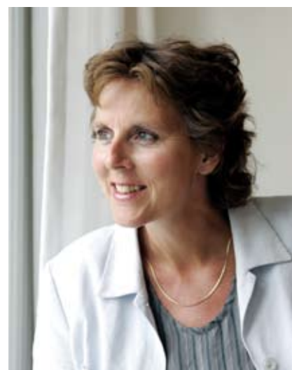
Miljøminister Connie Hedegaard (K) udformede den første lov og bekendtgørelse om elskrot. Inden årsskiftet vil hun sætte sin underskrift på en revideret bekendtgørelse.

"Men jeg tror ikke, at det i alle tilfælde skyldes